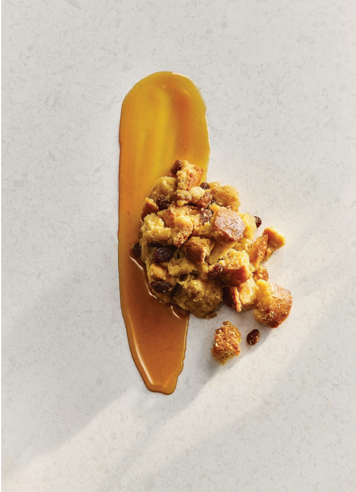
Pouding au pain et à l'érable recette à la page 73