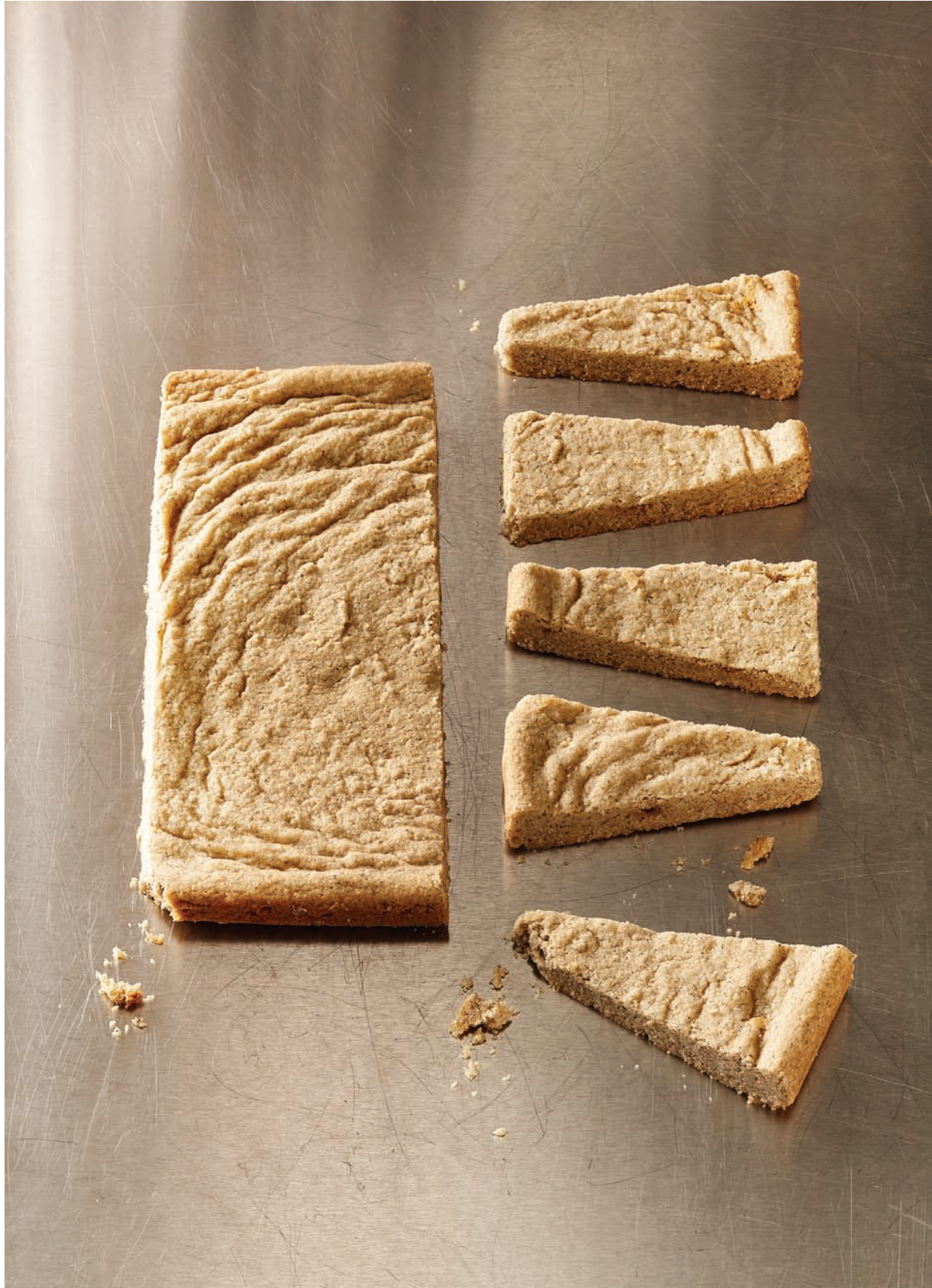
Sablés au sarrasin et à l'érable recette à la page 74