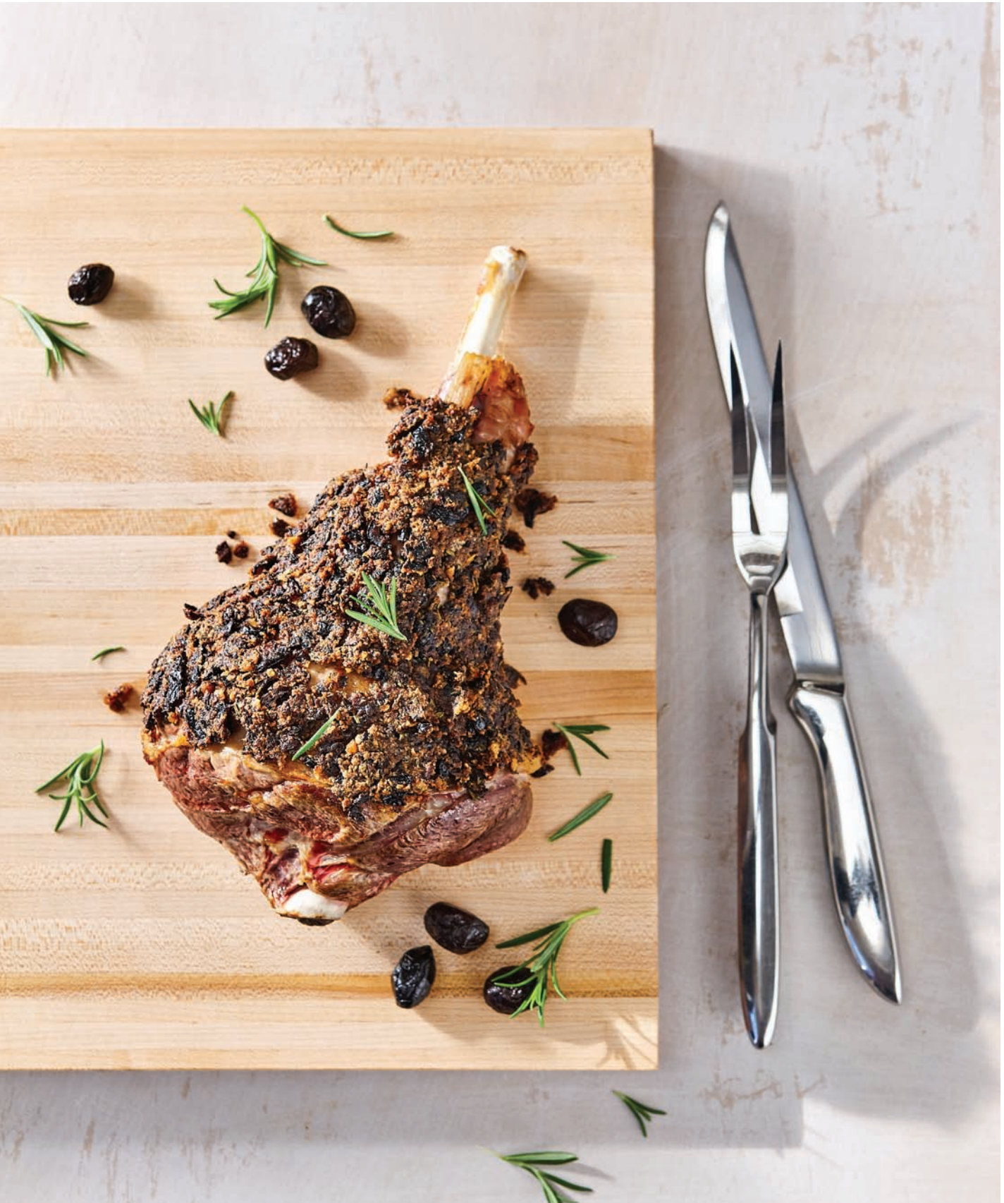
Gigot d'agneau, tapenade d'olives à l'érable et au romarin recette à la page 76